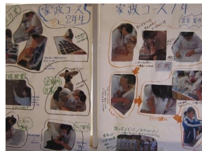
家政コース授業の様子