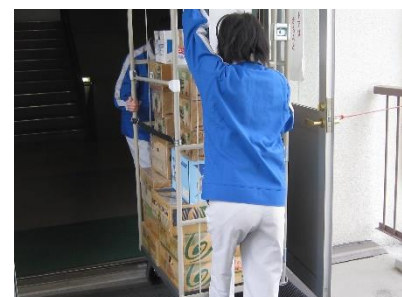
流通サービスコース