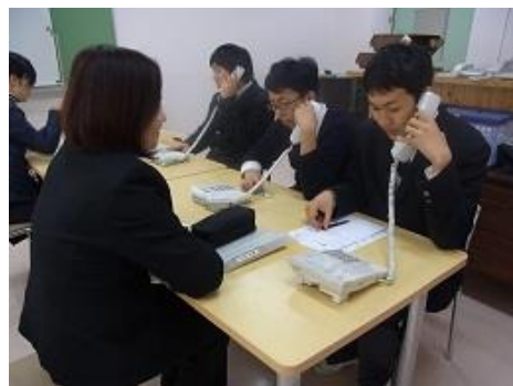
電話の対応マナー講座

3年生は就労前実習として2回目のキャリアトレーニングに入りました。この実習は、「卒業後の生活に見通しをもち、課題を見つけ解決する」「就労先の職業生活に必要な知識、技能、態度などの基礎的なスキルを身につける」ことを目標としています。入社後、スムーズに職業生活に入れるように1回目は3週間、2回目は2週間の期間で行っています。キャリアトレーニング後は、社会人前講座、卒業研修、卒業生を送る会、といよいよ卒業に向けてのカウントダウンです。