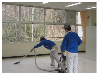
環境サービスコース