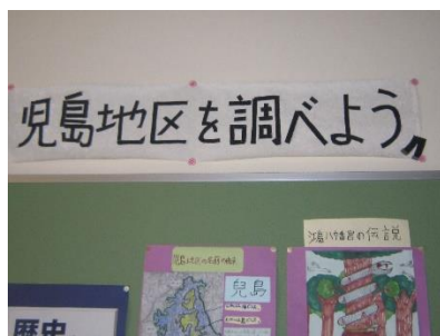
1年「総合的な学習の時間」