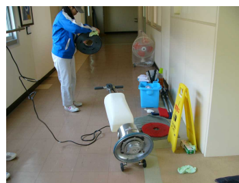
環境サービスコース