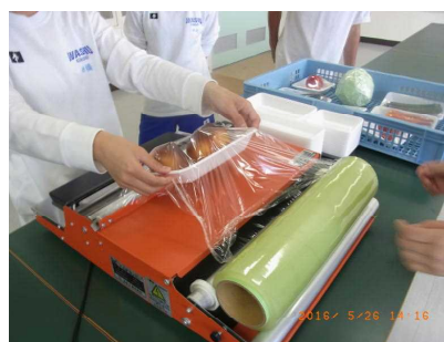
ラッピング作業の様子

4 場所 岡山県立倉敷琴浦高等支援学校 倉敷市児島田の口1-1-16 TEL 086-477-9301 ホームページ http://www.kotosien.okayama-c.ed.jp/