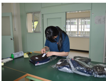
流通サービスコース