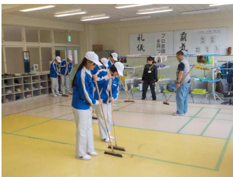
床掃除（環境サービスコース） 自在箒の使い方を学びました