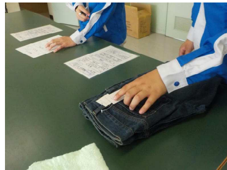
検品（流通サービスコース） 商品をチェックして記入しました